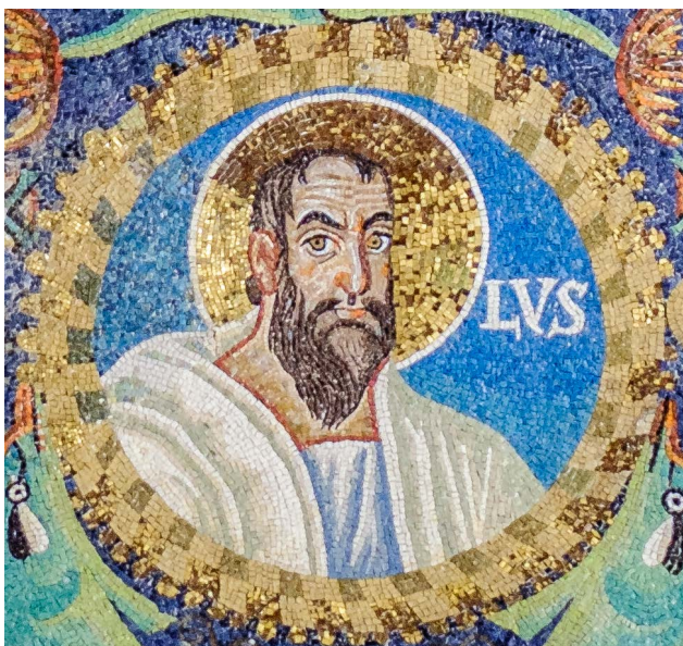
Mosaik föreställande aposteln S:t Paulus, San Vitale-basilikan, Ravenna, 500-talet.

Sedan har vi αναβιβίωκα, "jag har levt upp igen". Det här verbets metaforiska betydelse är inte belagd tidigare. Gäller till exempelvis även αναγέννησις "pånyttfödelse". I Platons Faidon 72 A där verbet förekommer är betydelsen annor-