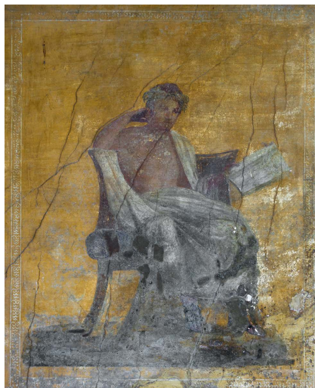
Fresk föreställande Menander från Pompeji.

Citaten ovan speglar Menanders sätt att uppleva världen. Det finns en slags pessimism som löper genom hela den grekiska litteraturen, särskilt alltsedan Mimnermos. Menander förefaller vara en besviken, desillusionerad människa. Men en sådan